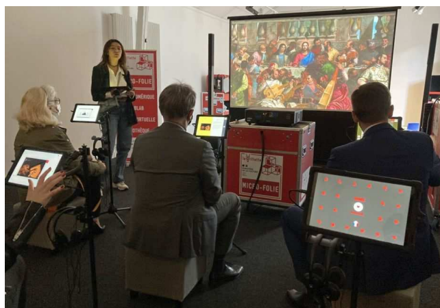
Un exemple de Micro-folie mobile : un musée virtuel

Cette appellation s'inspire de la réalisation de 26 bâtiments permettant de créer des événements au cœur du parc de La Villette et rappelant les constructions ludiques des parcs et jardins du XVIIIème siècle que l'on appelait des « folies ». Celles installées sur le territoire seront de plus petite taille.