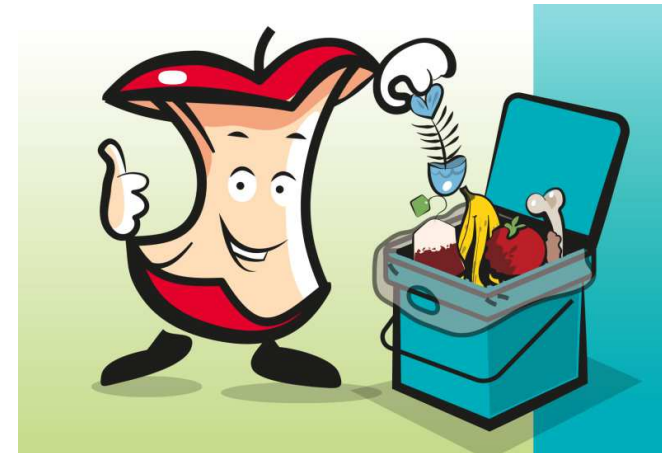
Illustration tirée du guide des déchets édité par la région Île-de-France

À compter du 1er janvier 2024, conformément au droit européen et à la loi antigaspillage de 2020, le tri des biodéchets est généralisé et concerne tous les professionnels et les particuliers.