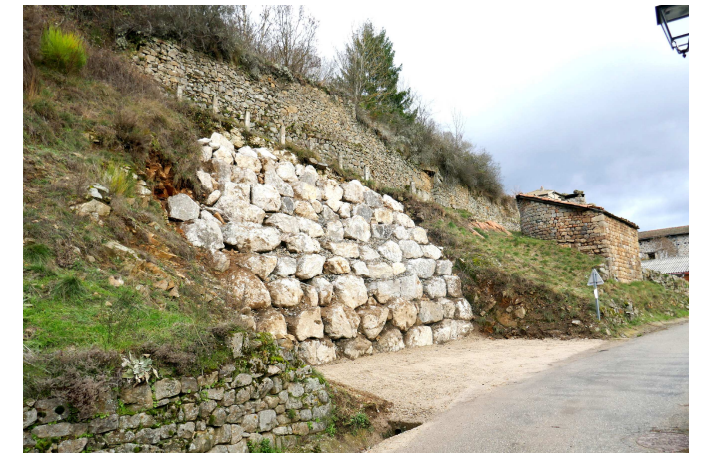
Enrochement a été réalisé par l'entreprise Faury

D'autres plus petits projets, comme par exemple la signalétique, seront discutés en commissions et conseils avant d'établir le budget communal en mars.