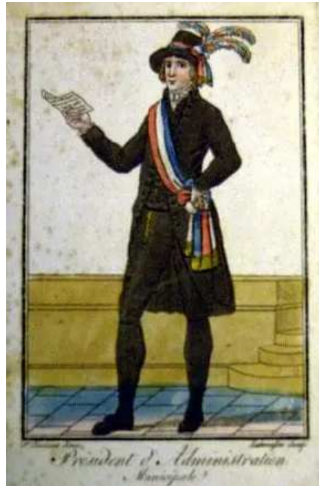
L'uniforme officiel d'un « président » de l'administration municipale avant l'appellation de « maire ». En pratique, il ne reste actuellement que l'écharpe tricolore de portée.

Les communes, créées à la Révolution, étaient gérées par un « conseil général de la commune », composé de :