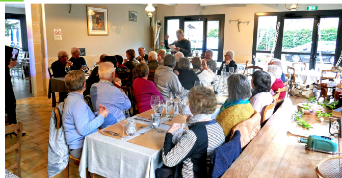
Le repas des anciens au Montagnard le 16 décembre 2022

Le 16 décembre dernier, 25 de nos anciens et anciennes se sont retrouvés autour d'un repas au restaurant Le Montagnard, avec les membres du CCAS.