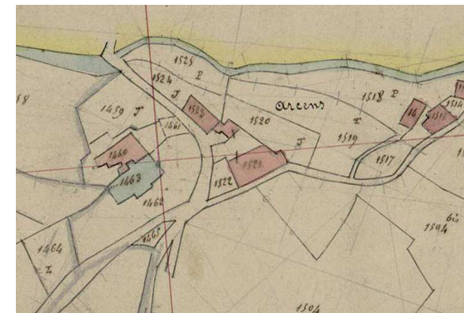
Extrait de la feuille C3 du cadastre de 1840. Le nord est vers le bas de la feuille, le couchant (ouest) est à droite. On remarque un large espace non aménagé devant l'ancienne église en bleu et sur son côté nord.